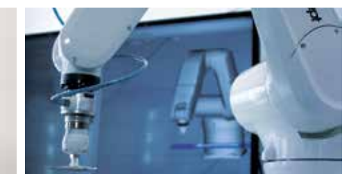
Support vor Ort