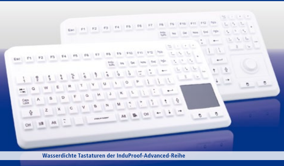
Wasserdichte Tastaturen der InduProof-Advanced-Reihe

Hygienegeeignete Tastaturen und Mäuse unterscheiden sich nach Funktionsanforderung, Verwendungsart und nach konkretem Einsatzbereich. So gelten in der Lebensmittelindustrie andere Kriterien als in Laboren oder im Krankenhaus. Der gemeinsame Nenner bleibt jedoch immer der gleiche: Die strikte Sauberkeit und der Schutz der Patienten, Kunden und Mitarbeiter vor Krankheitserregern. Typische Charakteristika der Dateneingabegeräte sind geschlossene Gehäuse, chemische Resistenz, Robustheit, leichte Bedienbarkeit, flache Benutzeroberflächen oder integrierte Spezialfunktionen wie Stand-By-Modi.