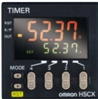
- Zeitrelais - Zwillings-Zeitrelais