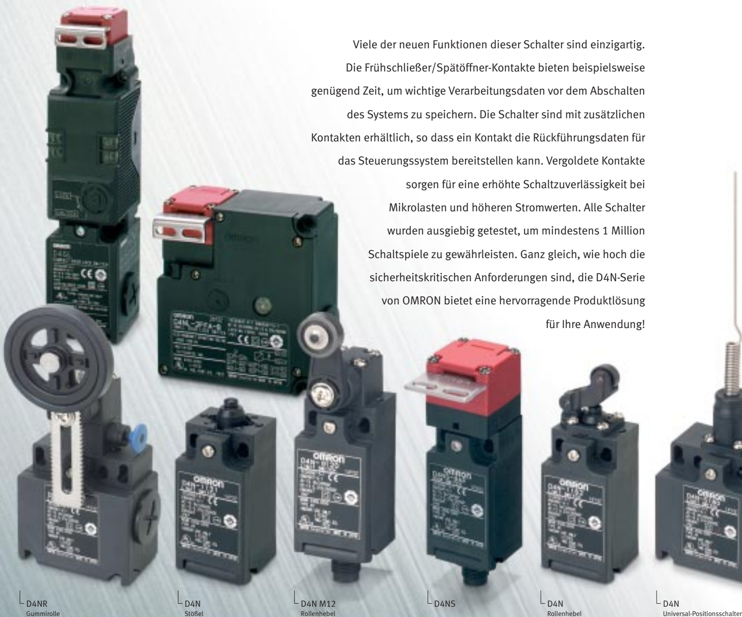
L D4NR Gummirolle

Viele der neuen Funktionen dieser Schalter sind einzigartig. Die Frühschließer/Spätöffner-Kontakte bieten beispielsweise genügend Zeit, um wichtige Verarbeitungsdaten vor dem Abschalten des Systems zu speichern. Die Schalter sind mit zusätzlichen Kontakten erhältlich, so dass ein Kontakt die Rückführungsdaten für das Steuerungssystem bereitstellen kann. Vergoldete Kontakte sorgen für eine erhöhte Schaltzuverlässigkeit bei Mikrolasten und höheren Stromwerten. Alle Schalter wurden ausgiebig getestet, um mindestens 1 Million Schaltspiele zu gewährleisten. Ganz gleich, wie hoch die sicherheitskritischen Anforderungen sind, die D4N-Serie von OMRON bietet eine hervorragende Produktlösung für Ihre Anwendung!